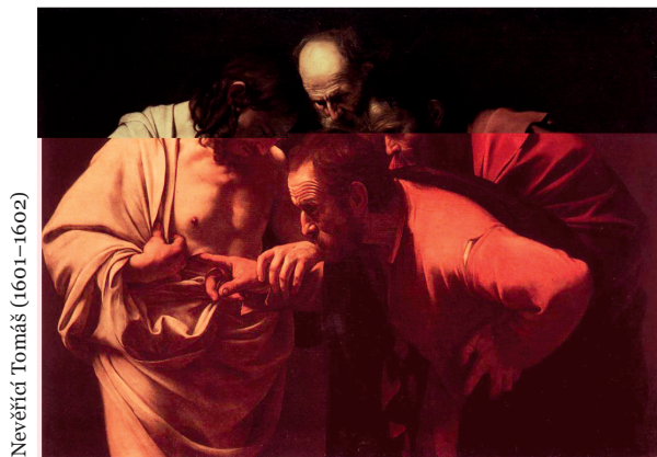
Nevěřící Tomáš (1601–1602)

Pane, děkuji ti, že tvá láska ke mně je silná jako smrt, tvá vášnivá zamilovanost je nezlomná jako podsvětí. Děkuji ti, že „zátopy vod a těžkostí nemožnou uhasit lásku a proudy řek ji neodplaví“ (srov. Pís 8,6-7). Amen.